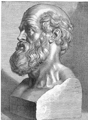
Hippocrates Kruiden & Voedingstherapie