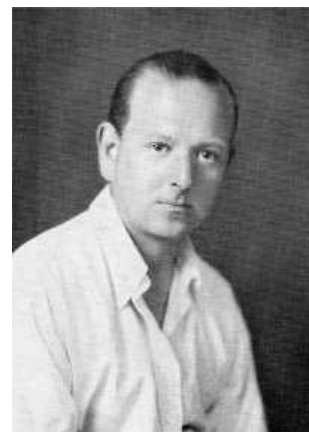
Edward Bach Bachbloemen Therapie