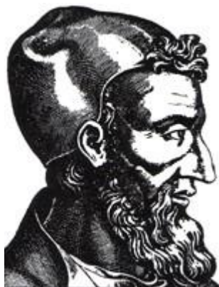
Galenus Vier Temperamentenleer